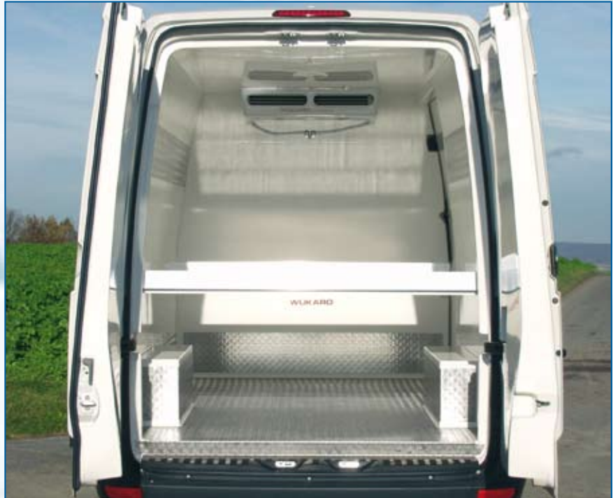
Ein- oder zwei Reihen eingelassene Aluminium-Scheuerleisten gegen Aufpreis lieferbar.

Voll integrierte Trittstufe mit Aluminium-Trittschutz.* alle mit * gekennzeichneten Ausstattungen sind serienmäßig.