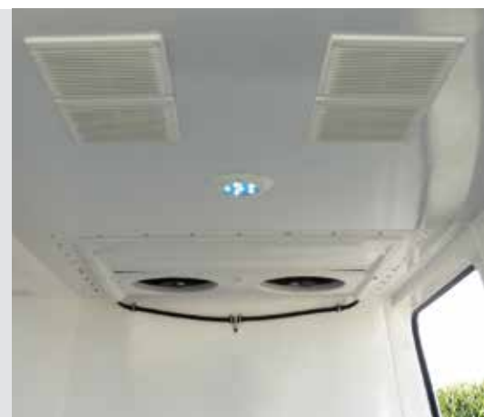
Sonderausstattung: Energiesparende LED-Innenleuchte mit Bewegungsmelder.