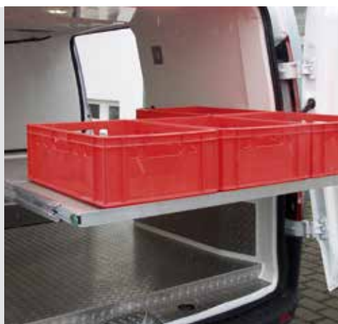
Sonderausstattung: Einfaches be- und entladen mit dem herauszieh- und höhenverstellbaren Zwischenboden.