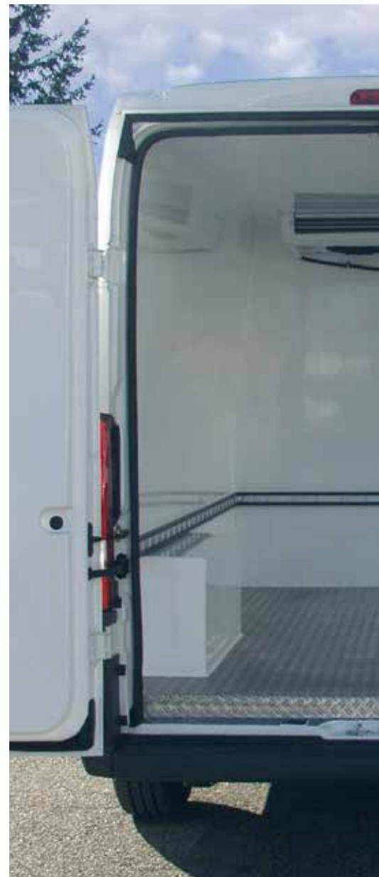
Innenausbau des Citroën Jumper mit integrierter Kühlanlage.