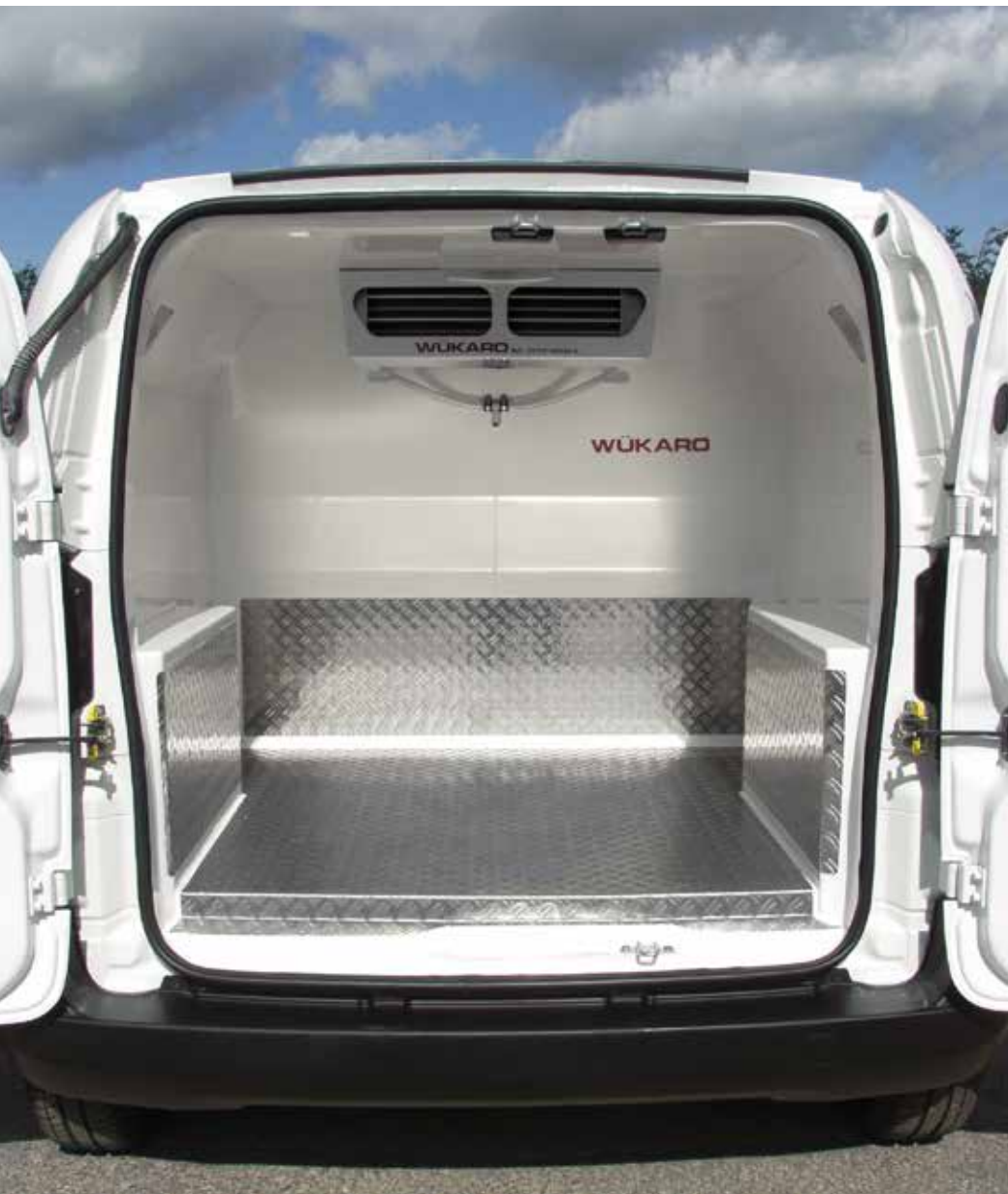
Innenausbau des Citroën Nemo mit integrierter Kühlanlage.