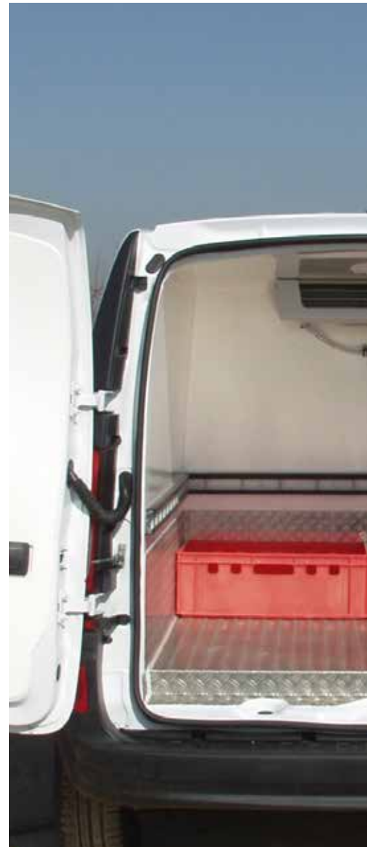
Innenausbau des Mercedes-Benz Citan mit integrierter Kü