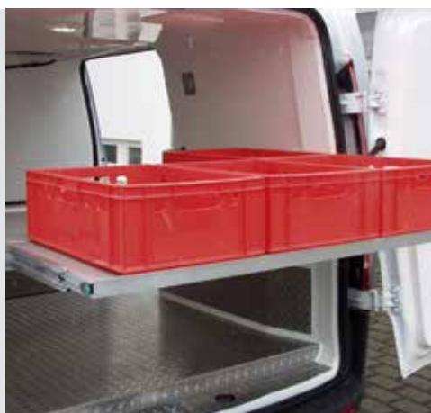
Sonderausstattung: Einfaches be- und entladen mit dem herauszieh- und höhenverstellbaren Zwischenboden.