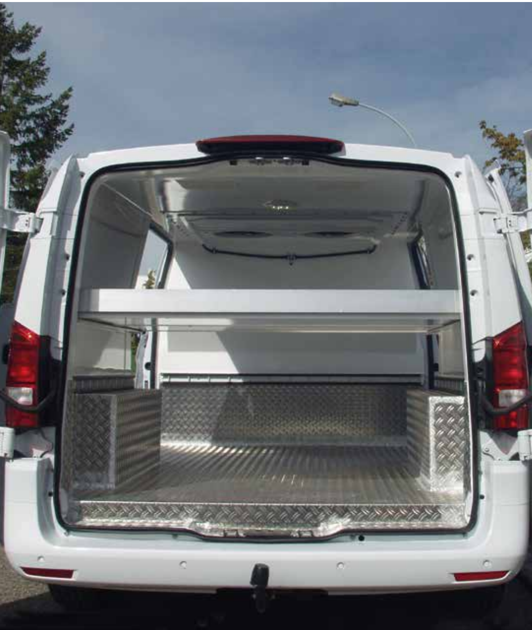
Innenausbau des Mercedes-Benz Vito mit vollintegrierter Kühlanlage.