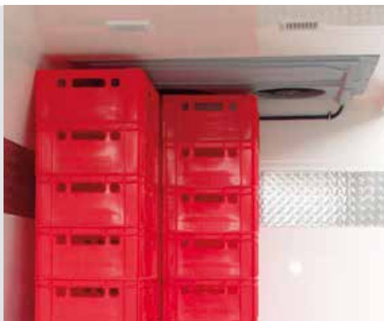
Mit der vollintegrierten Kühlanlage gibt es keinen Platzverlust mehr im Innenraum.